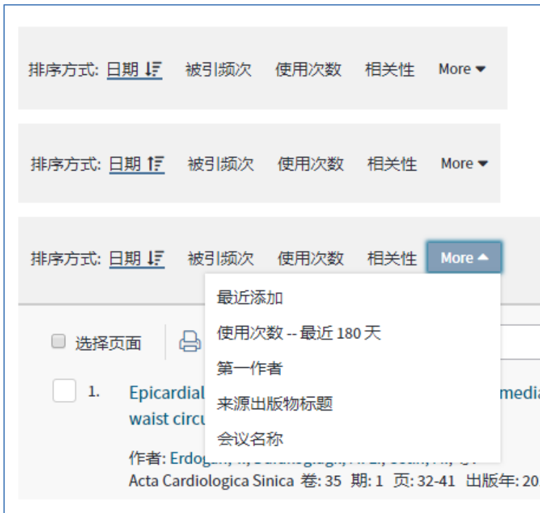
图 2. 调整后的排序选项，方便用户在针对“日期”排序和“被引频次”排序时实现升降序一键切换。其他排序方式被精简归入“More”下拉菜单中。上图仅用于示例。